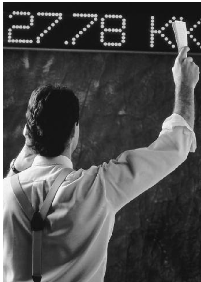
„Viel Geld machen kann schnell einer, doch die Kunst liegt darin, gut mit viel Geld umzugehen.“

Wenn man zuviel hat. Es macht einen fast zappelig. Wenn Menschen zu schnell zuviel Geld verdienen, stellt das eine große Prüfung dar. Es entsteht dann woanders ein Manko. Viel Geld machen kann schnell einer, doch die Kunst liegt