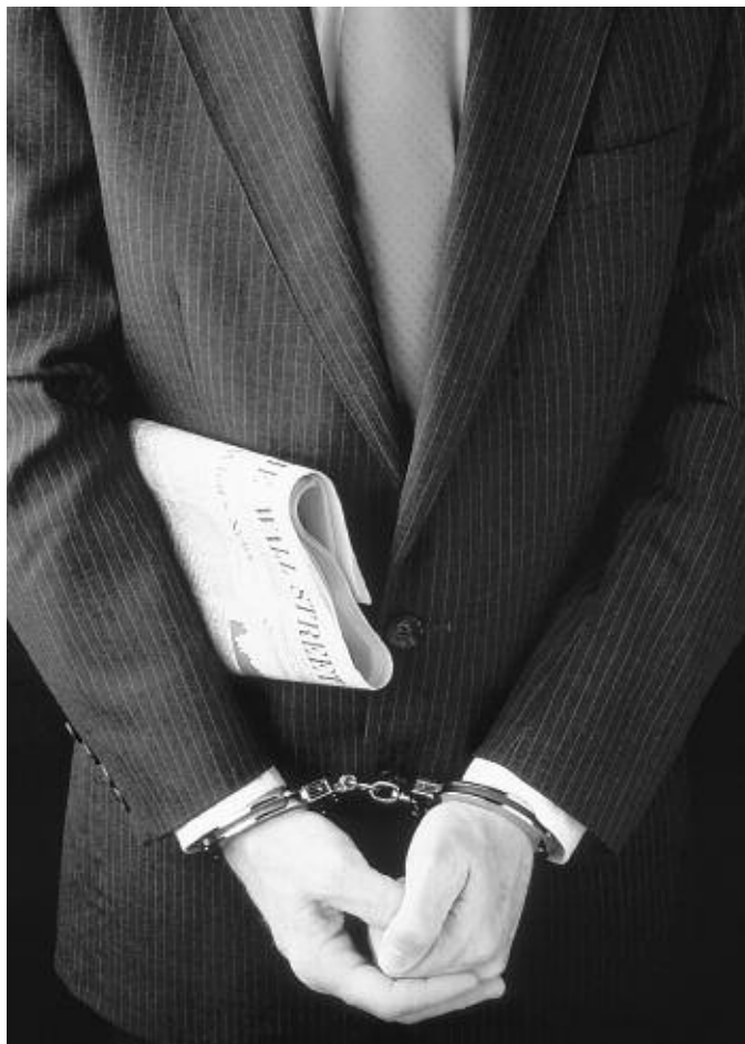
„Es gibt an der Börse ein paar Abenteuerertypen. Die sind heute ganz oben und zwei Jahre später vielleicht im Knast.“

Viel Geld bedeutet gar nicht wahren Reichtum. Wahrer Reichtum besteht darin, das tun zu können, was einen glücklich macht. Und wenn man dies tut, dann kommt auch das Einkommen hinzu, das man benötigt. Das Geld fließt, ist ausgeglichen, wir haben keine Sorgen damit. Das Geheimnis liegt vielleicht darin, daß man danach trachtet, das zu tun, was einen glücklich macht, statt das zu tun, was einem Geld einbringt. Wenn jemand also sagt, ich mache jetzt eine Banklehre, weil man auf der Bank gut verdient, ist dies ein vollkommen falscher Beweggrund.